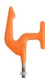
DT 600 Hak podwieszający