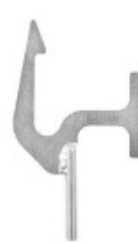
DT 600 Hak podwieszający