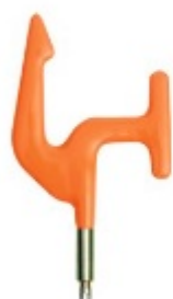
DT 600 Hak podwieszający