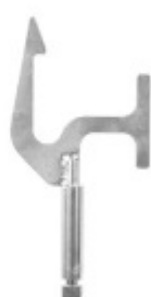
DT 600 Hak podwieszający