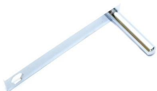
DWK 35 VC