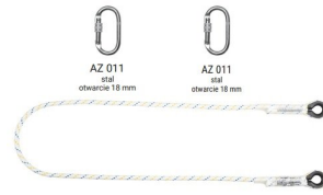
AZ 011 stal otwarcie 18 mm