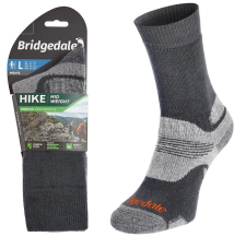
Tabela rozmiarów - skarpety